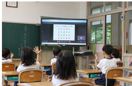
ビジョントレーニング（特別支援教育）の体験

6月16日（金）リモート集会を行いました。苦手なことがない人は一人もいない。だから、周囲の子の苦手を共感的に理解したり励ましたりしながら、全ての人が安心していられる大串小学校をつくっていくことを学びました。特別支援教育を大切にしてきた大串小学校のベースとなる部分について確認ができました。